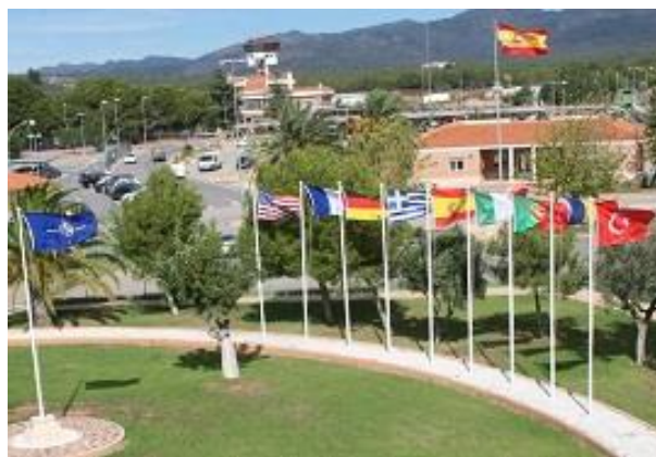
Figura 1. Base Militar Jaime I, Bétera (Valencia)

Dentro de este LTCP, los distintos cuarteles generales de la NFS pueden ser ofrecidos para cuatro roles diferentes, siendo uno de estos el de Warfighting Corps (WFC) o Cuerpo de Ejército en operaciones de alta intensidad. Estos roles se asumen por años naturales en un turno rotatorio, lo que supone un año de adaptación, preparación, evaluación y certificación, y otro año natural en periodo de alerta o stand-by . El 1 de enero del 2022 el HQ NRDC-ESP inició su periodo de stand-by o alerta como Warfighting Corps de la Alianza, por lo que durante el 2022 estuvo preparado y certificado para poder asumir los compromisos adquiridos con la Alianza Atlántica. El rol de Warfighting Corps , relativamente nuevo, suponía para el HQ NRDC-ESP estar en condiciones de dirigir hasta 5 divisiones en una operación convencional de alta intensidad (aproximadamente 120.000 militares).